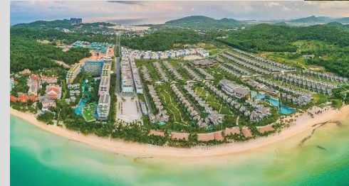
빈그림 빈홈스 프로젝트

VINHOMES - 푸꾸옥 (Phú Quốc) VINHOMES - 스마트시티 (Smart city)